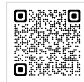
〈「聖地巡礼バス」公式HP〉