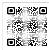
「悠遊フリー乗車券」公式HP