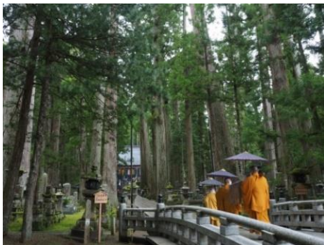
奥之院 しょうじんく 生身供

高速バス「京都高野山線」は直通 約2時間30分 で京都と高野山を結びます。乗り換えが必要な鉄道移動に比べ、お客様の利便性は格段に向上します。